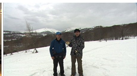
日本有数の豪雪地、西川町の月山。