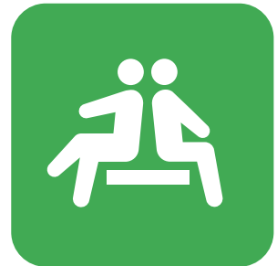
休憩所 REST SPACE 休息區