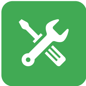
工具 TOOLS 維修工具