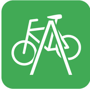
サイクルラック BIKE RACKS 停車架

専用のウェアやシューズを身につけたサイクリストは、飲食店などの利用を躊躇する方も少なくありません。サイクルステーションとしての表示などがあると、サイクリストも安心して利用できます。