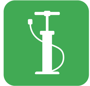
空気入れ PUMPS 打気筒