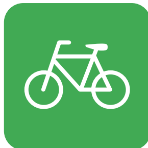
レンタサイクル RENTALS 自行車租賃