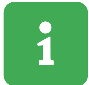
観光情報 INFO 旅遊資訊