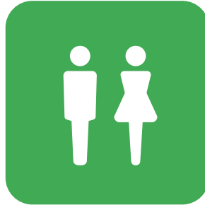
トイレ RESTROOMS 洗手間