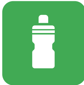
給水 WATER 給水站