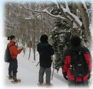
スキー場の林の中に入って自然観察ができます