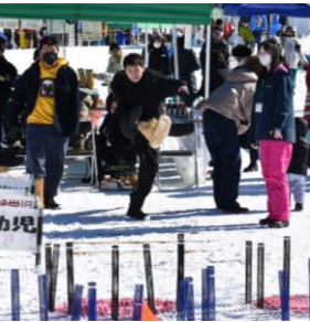
雪上で1日限りの楽しいイベントが満載

1組 500円 (チケット5枚) 事前販売のご案内 ・産直あさひ・グー ・朝日庁舎産業建設課(平日のみ) 当日は イベントに 直行できます