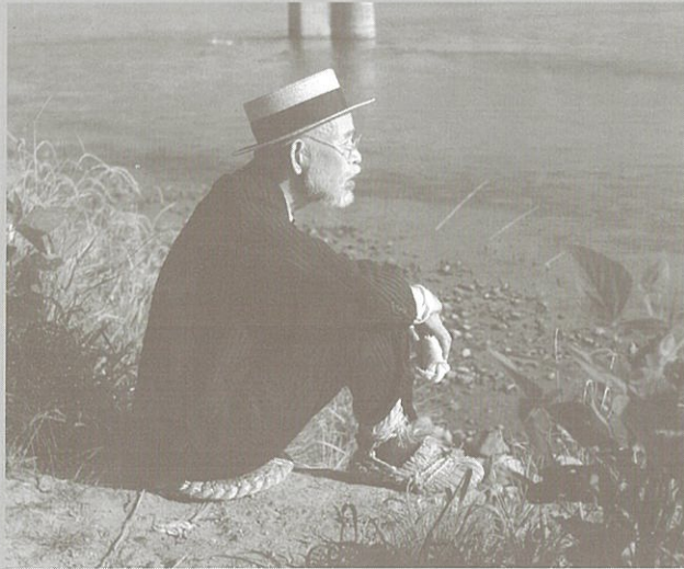
※写真：大石田の最上川のほとりにて