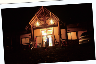
まだ夜中！満天の星空

初級レベルの登山です。 小学生でも楽しんで参加していただいています。 参加者には記念品、体験中の写真データプレゼント