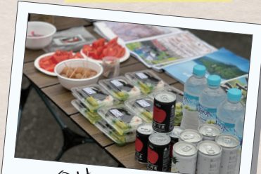
地元食材 朝食のお振舞い