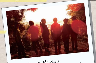
コーヒーを片手に朝日を待つ