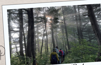
夜明け前とは別世界！ 爽やかな朝のトレッキング