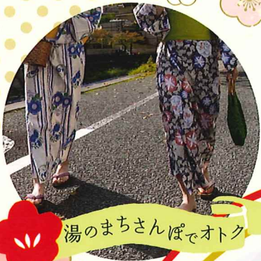
湯のまちさんぽでオトク