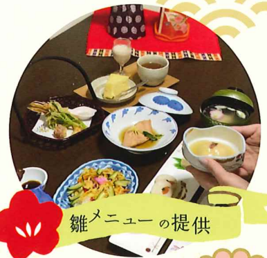
雑メニューの提供

あ つみ温泉ひなまつりは、With コロナの時代だからこそ日本古来の季節の催しを楽しむ機会を作ろうという想いから企画されました。「癒し」と「楽しみ」を提供するべく安心安全な環境づくりを徹底するとともに、3つの楽しみ方をご用意しております。あつみで待ってるの～!