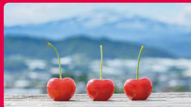
甘くて大きい期待の新品種「やまがた紅王」