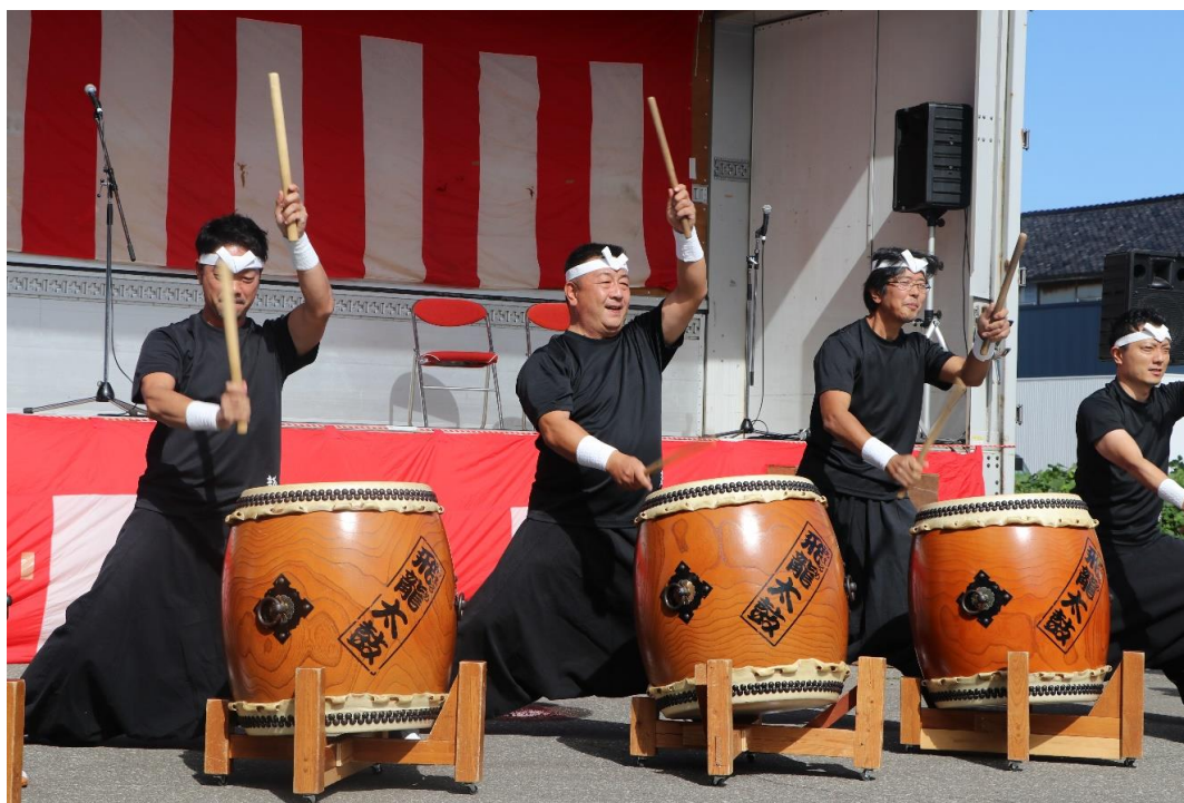
しょうない秋まつり(庄内町)