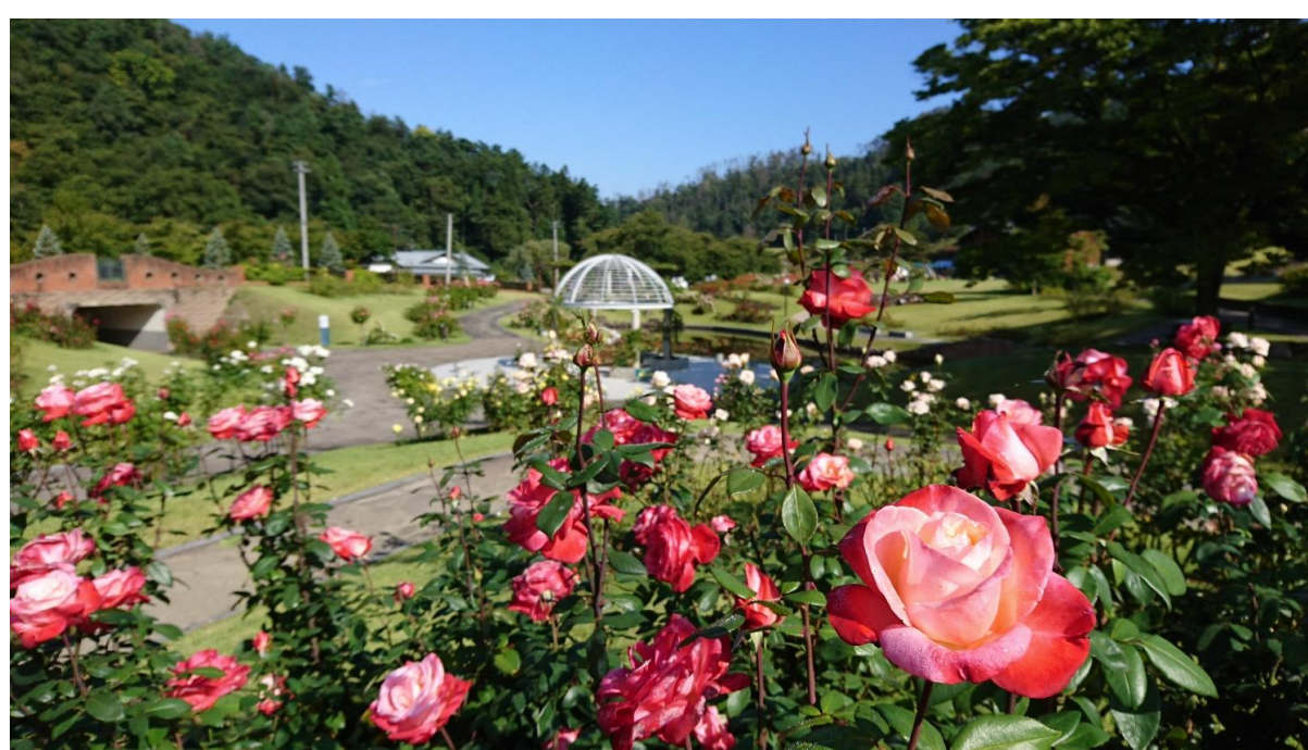
秋のバラまつり(村山市)