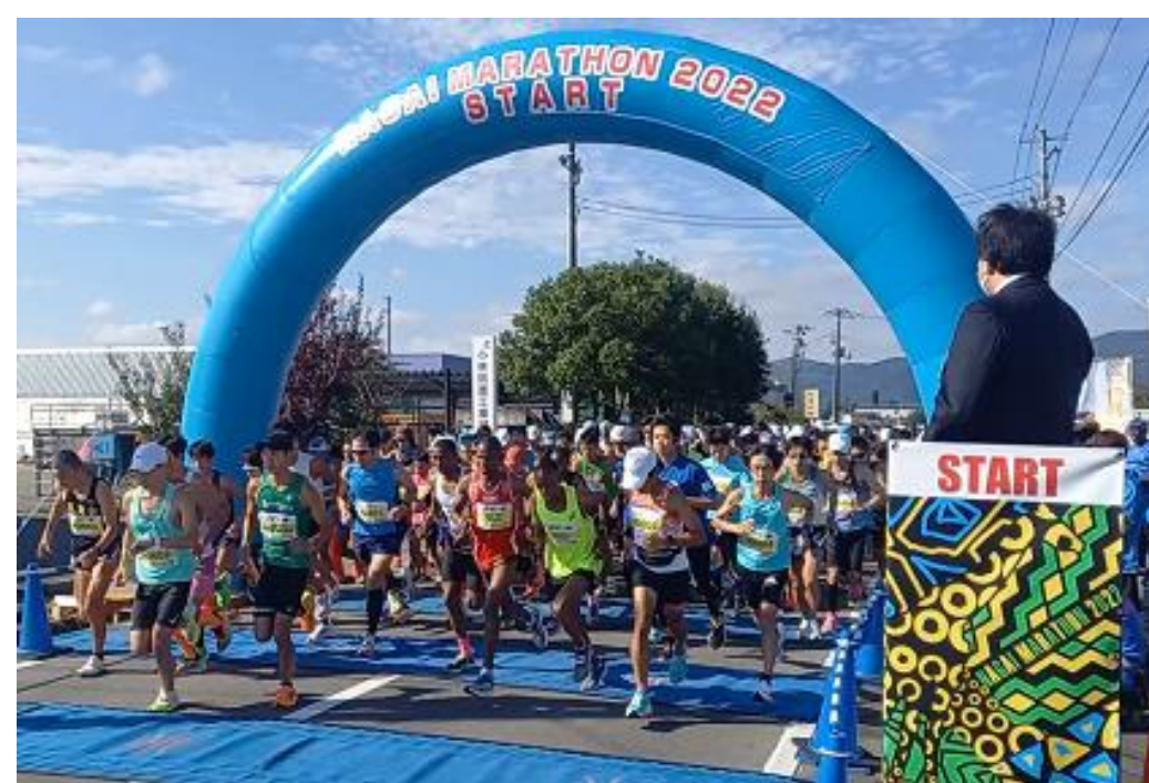
長井マラソン(長井市)