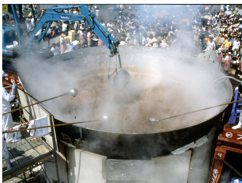
日本一の芋煮会フェスティバル(山形市)