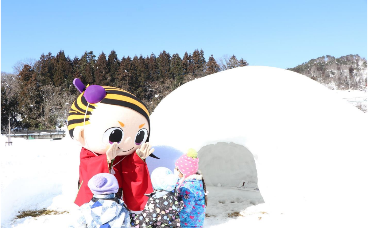
紅花資料館ふゆまつり(河北町)