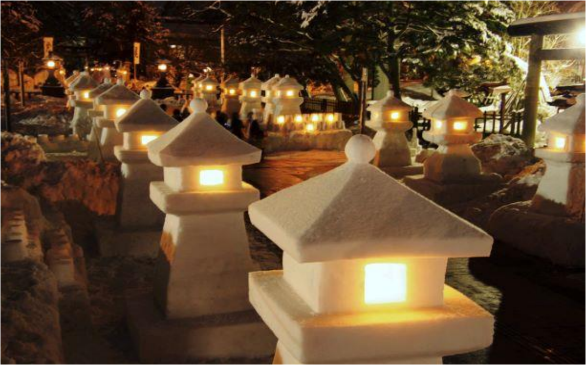
第49回上杉雪灯籠まつり(米沢市)